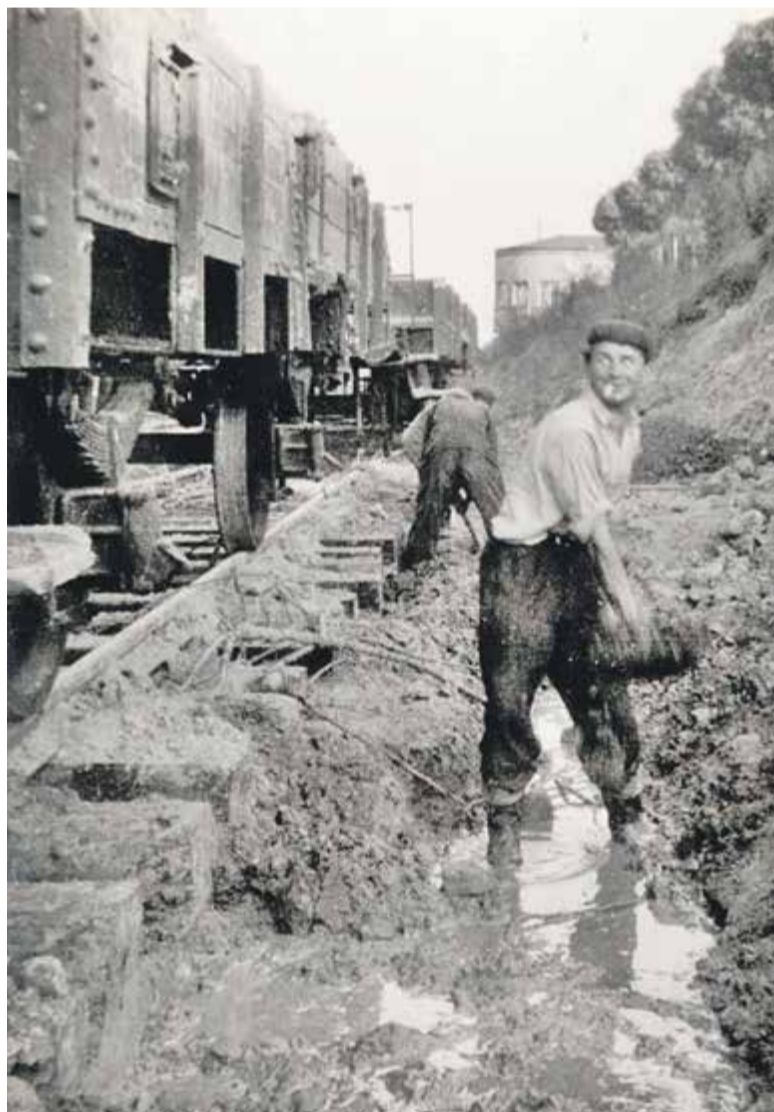
Budowa drugiego toru około 1961