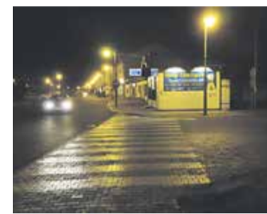
Zakręt i przejście przy cukierni

Idąc chodnikiem w stronę dawnej jednostki wojskowej, trzeba przejść przez zebra. Nierzadko bywa, że kierowcy wyjeżdżający z ulicy Białka do głównej drogi po prostu nie widzą