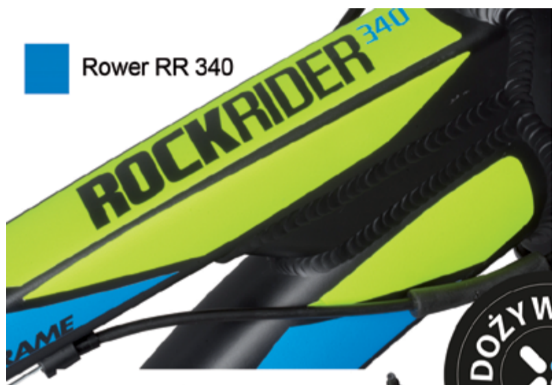
Rower RR 340