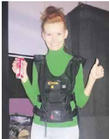
Sołtys wsi na wspólnym wyjeździe

Prowadzę rozmowy z Gminą na temat linii autobusowej. To dla nas