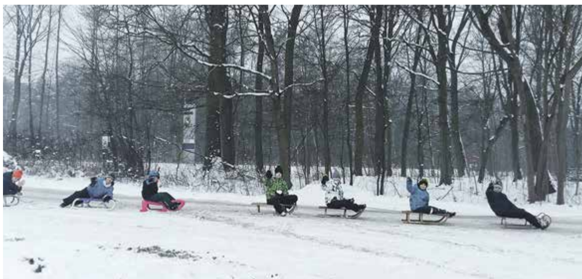
Kulig zorganizowany w Solcu

Sołectwo Solec zaprasza wszystkich czytelników do odwiedzenia naszej strony oraz na Bieg Kupały organizowany w Solcu 23 czerwca 2016 r. – impreza ma charakter ogólnokrajowy.