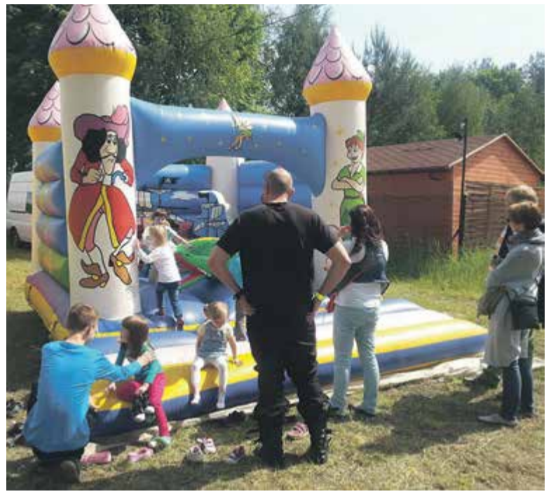
Dzień dziecka przyciągnął małych i dużych

N.B.: Cieszę się, że mieszkańcy chcą uczestniczyć w życiu społecznym i coraz częściej to robią. Coraz większe