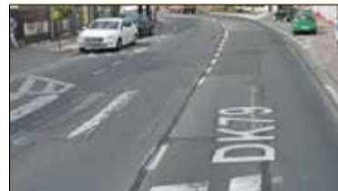
Góra Kalwaria. Niebezpieczne pasy s. 8