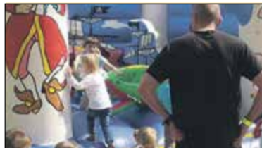
Solec. Problemy i marzenia s. 4