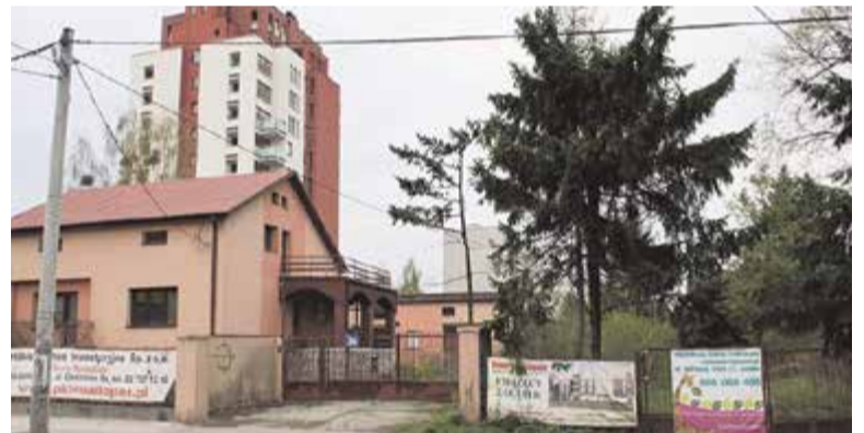
W tym miejscu miały powstać 10-piętrowy budynek

Dwie działki, o których mowa, zlokalizowane są między ulicami Jana Pawła II i Fabryczną nieopodal bazaru. Głośno się o nich zrobiło 3 lata temu za sprawą najbliższych sąsiadów – Wspólnoty „Pod Dębem”, która usiłowała (skutecznie póki co) zablokować zaplanowaną na ich terenie inwestycję, czyli budowę dziesięciopiętrowego bloku.