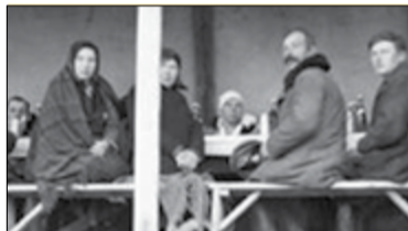
Ocalić od zapomnienia. Historia dworca PKP s. 7