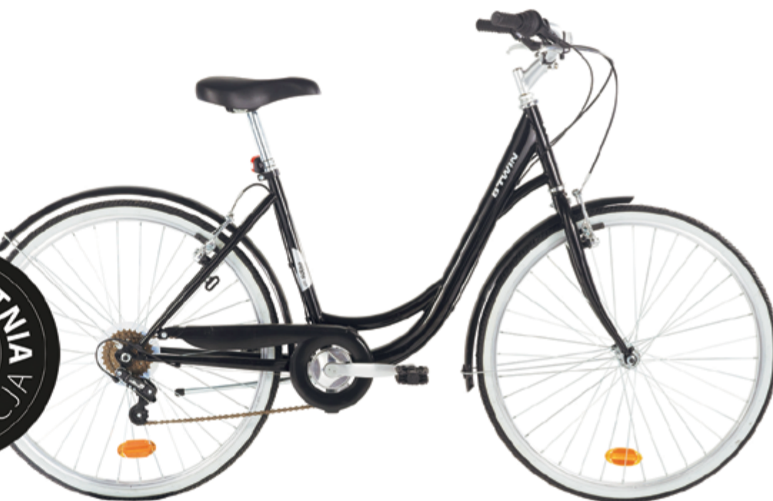
Rower ELOPS 100 (8305485) cena 599,99.

(8321326, 8351519, 8351518, 8302232, 8351516, 8351517) cena 799,99.