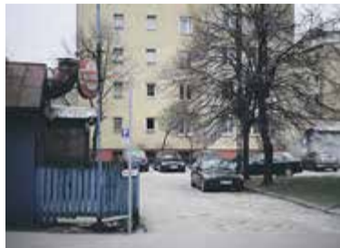
Wjazd na osiedle przy ulicy Wyszyńskiego

Konkretnie okolice przystanku ZTM „Pijarska”. Niejednokrotnie widziano w tym miejscu radiowóz policyjny. Uważać trzeba przy wjeździe na usytuowane po drugiej stronie domu pomocy społecznej osiedle. Jeden z barów znacznie ogranicza widoczność, ponadto wyjeżdżający z parkin-