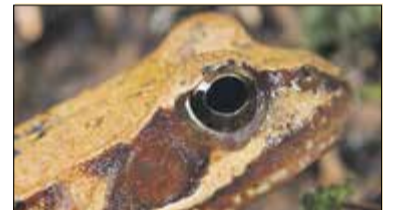
Zalesie Górne. Uważaj na żaby s. 12