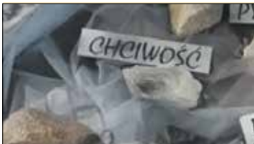
Skolimów. Kontrowersje wokół grobu s. 3

PIASECZNO || GÓRA KALWARIA || KONSTANCIN-JEZIORNA || LESZNOWOLA || PRAŻMÓW || TARCZYN