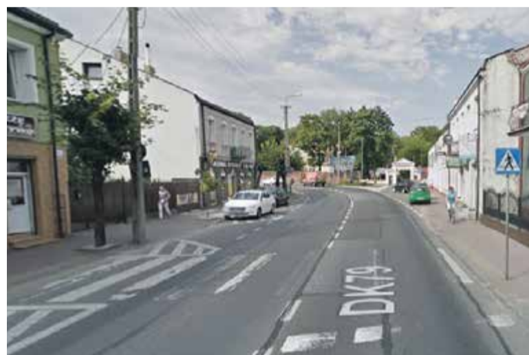
Niebezpieczne przejście przy jednostce wojskowej

Przed pasami znajduje się dosyć duży zakręt, zdarza się, że piesi nie mogą dostrzec rozjeżdżonych kierowców.