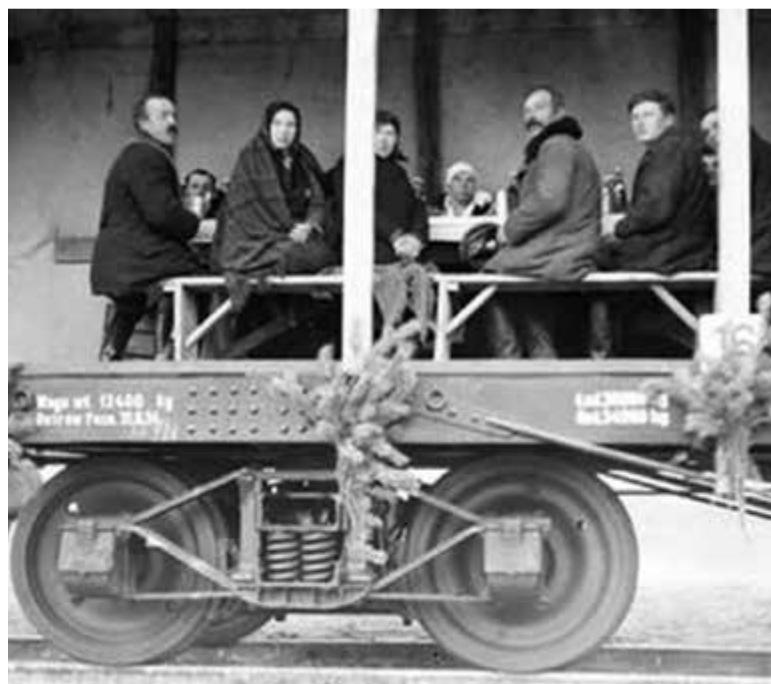
Uroczysty posiłek na platformie w Bartodziejach