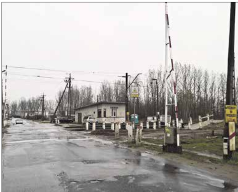
Przejazd kolejowy na ulicy Karczunkowskiej