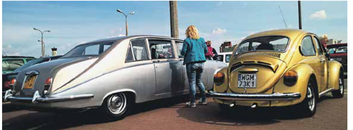
Klasyki motoryzacji w Piasecznie