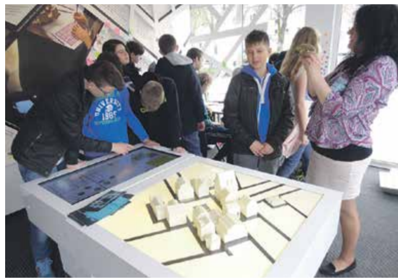
Zajęcia w „Muzeum na Kółkach”

Do Góry Kalwarii zawiątał światowej sławy mandolinista z zespołu The Ger Mandolin Orchestra, Czech Radim Zenkl. Siedzący w wypełnionej po brzegi sali widzowie nie mogli doczekać się wyjścia artysty na scenę. Radim zaprezentował różne style muzyki, w jego repertuarze znaleźć można było między innymi bluegrass, muzykę irlandzką, polską, czeską, a także inne, bardzo oryginalne utwory. W trakcie koncertu muzyk korzystał z różnorodnych instru-