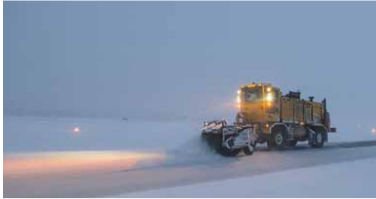
W tym roku pługi nie wyjeżdżały na drogi zbyt często

To, co rozczarowuje jednych – święta i ferie bez śniegu – cieszy innych. Tegoroczna zima rozpieszczała drogowców. Poza jednorazowym paraliżem, kiedy to śnieg padał przez kilka godzin, a służby z efektami tego zimowego ataku walczyły blisko tydzień, przez resztę zimowych miesięcy pługi i piaskarki mogły zapaść w sen zimowy. Efektem budżetowym tej aury stało się 800 tys. złotych oszczędzone przez Wydział Utrzymania Terenów Publicznych. W związku z tym pieniądze te mogą być przeznaczone na inne zadania.