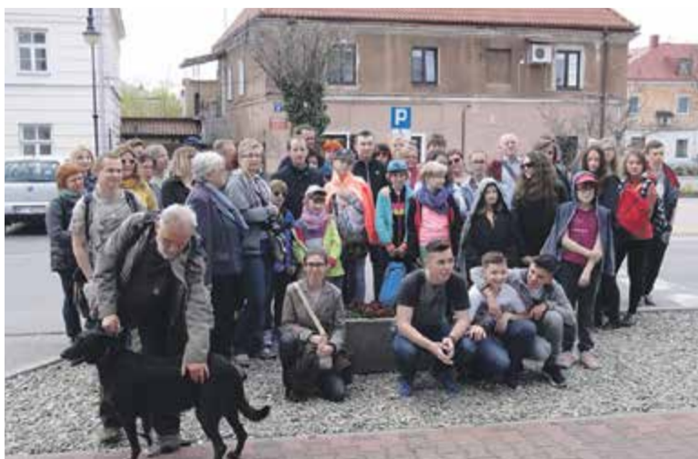
Uczestnicy spaceru na tle „ulicy Koziej”