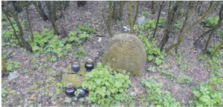
Kirkut w Tarczynie

Kirkut znajduje się przy ulicy Długiej, naprzeciwko cmentarza parafialnego. Organizatorzy wrę-