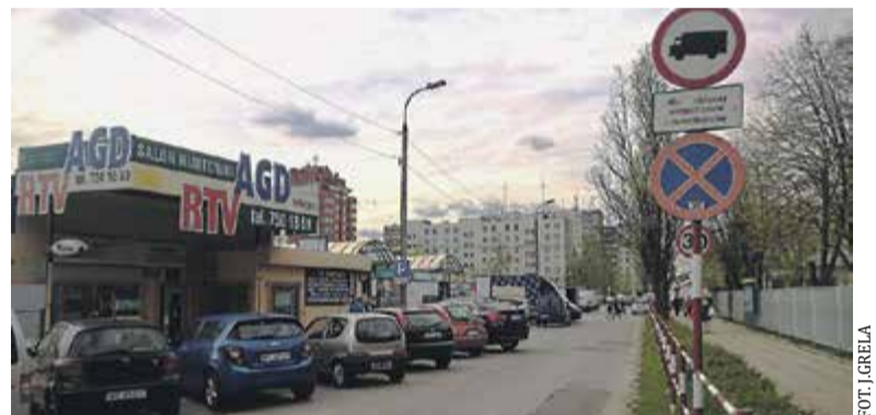
Przejazd czy zaparkowanie na ul. Szkolnej w godzinach pracy szkoły i bazaru wymaga dużo cierpliwości