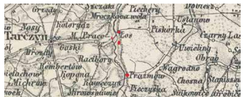
Mapa austriacka z 1873 (zaznaczono: Łoś, młyn, dwór Mysyrowiczów i Prażmów)