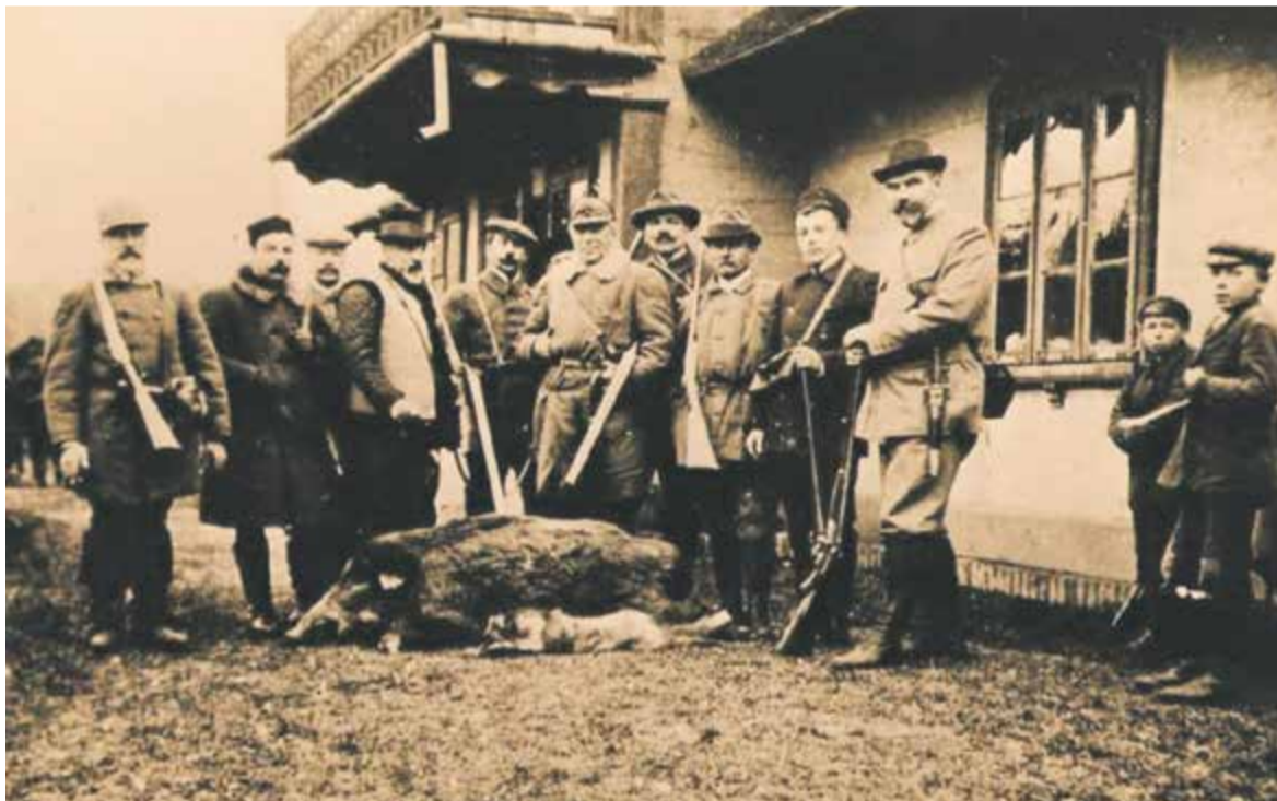
Po polowaniu w Łosiu

napisz do autorki m.szturowska@przebladpiaseczynski.pl