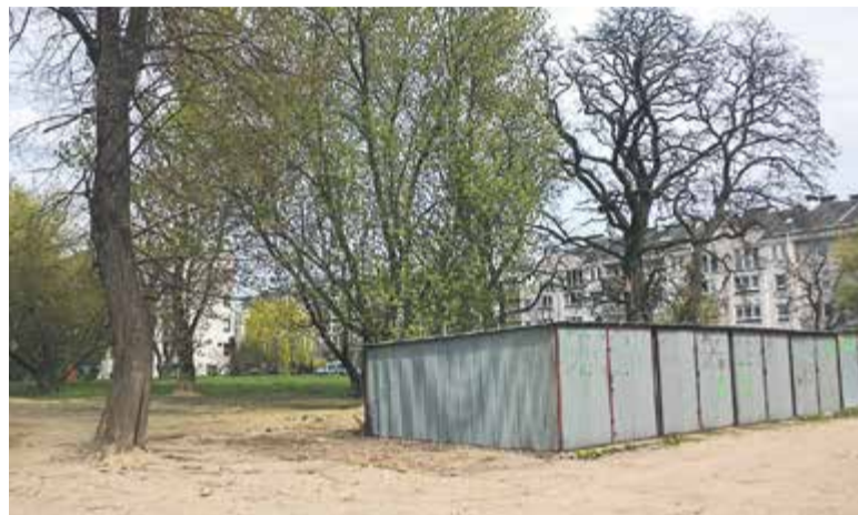
Obecny wygląd skweru na rogu Warszawskiej i Młynarskiej

Wiosną przyszłego roku mają rozpocząć się prace na skwerze na rogu ulic Warszawskiej i Młynarskiej. Na terenie o powierzchni 5 tysięcy mkw. mają powstać alejki parkowe, klomby z zielenią, a w jego centralnej części