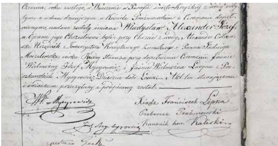
Akt urodzenia Władysława Mysyrowicza (syna)