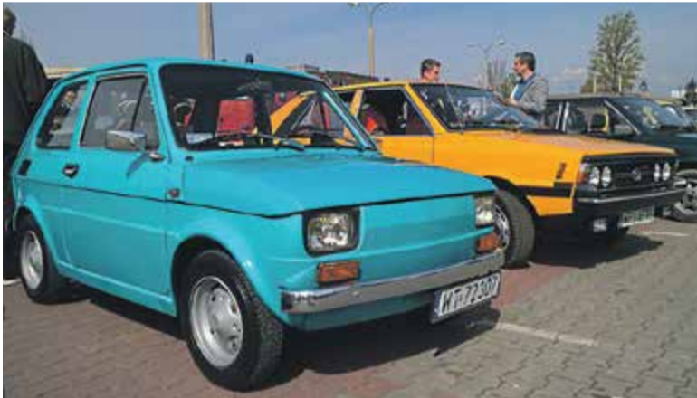
Fiat 126p i Polonez „Borewicz”