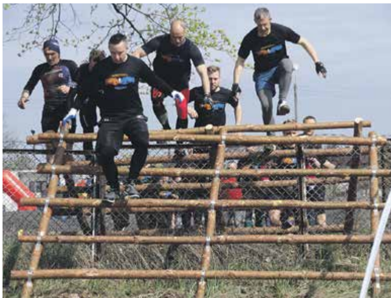
Przejście ze stadionu na poligon