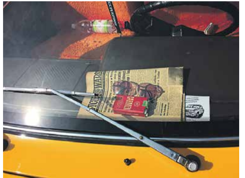
Wnętrze Poloneza „Borewicz”