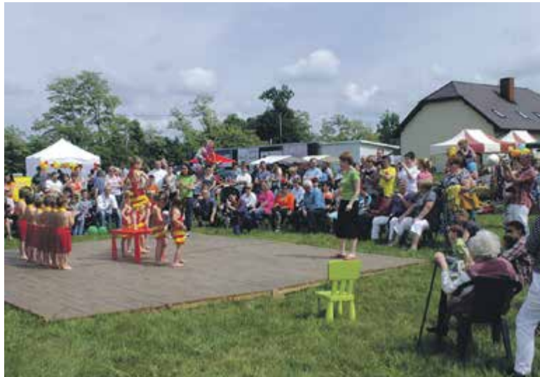
Łosiowisko – impreza organizowana przez sołectwo

B.K.: Jako mieszkańcy Łosia mieliśmy świadomość, że jednym z celów, które trzeba zrealizować, jest zbudowanie miejsca, które będzie służyło nam wszystkim. Ustaliliśmy, że będzie to Wiejski Klub Kultury. Czekamy z niecierpliwością na zakończenie prowadzonych robót budowlanych. Poświęciliśmy od 2011 roku nasz fundusz sołecki na powstanie tego miejsca – m.in. na przygotowanie terenu pod budowę. Zastanawialiśmy się, jak zagospodarować to miejsce. Z naszych ustaleń wynika, że ma to być miejsce poświęcone właśnie kulturze – chcemy tam organizować koła, kluby zainteresowań, spotkania, być może pojawią się też sekcje sportowe. Chcielibyśmy też zorganizować tu muzeum, coś w rodzaju izby pamięci o historii Łosia i naszego najbliższego regionu.