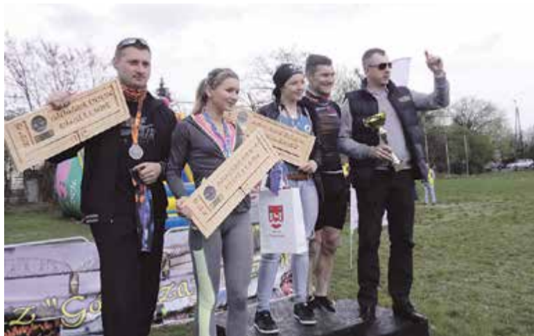
Zwycięzcy biegu wraz z wicestarostą

Sześciokilometrowy bieg rozpoczął się z małym opóźnieniem, gdyż uczestnicy musieli przeparkować samochody, które zastawiały trasę przy mecie. Mimo że skoki przez vana nie zostały przez organizatorów przewidziane, na zawodników czekało mnóstwo innych przeszkód... Bieg przez opony, rampa, równoważnia, zasieki, kontener wypełniony lodem – to tylko niektóre z nich. Ponadto żywa przeszkoda stanowiła żołnierze z FIA – Wierni w gotowości pod bronią – co chwila rzucający różnego rodzaju petardy, granaty. Około godziny 10 z mety na stadionie wystartowała pierwsza grupa zawodników. Zaraz za nimi pobiegły dopingujące ich