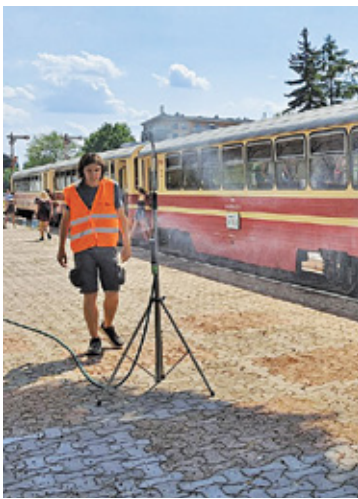
Wodna mgiełka przyjemnie chłodzi

Oczywiście kolejarze zapraszają też na wycieczki wąskotorówką. W wakacje przejazdy organizowane są w każdy weekend. W soboty o 14.00 kolejka odjeżdża w ramach przejazd-