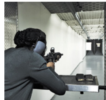
Na razie strzelnicy dla młodzieży nie będzie

Po wybuchu wojny w Ukrainie potrzeba tworzenia tego typu miejsc stała się jeszcze większa, a o środki na budowę z puli MON miało ubiegać się piaseczyńskie starostwo. O stan prac nad wnioskiem, który można składać już tylko do 30 czerwca, dopytywał radny