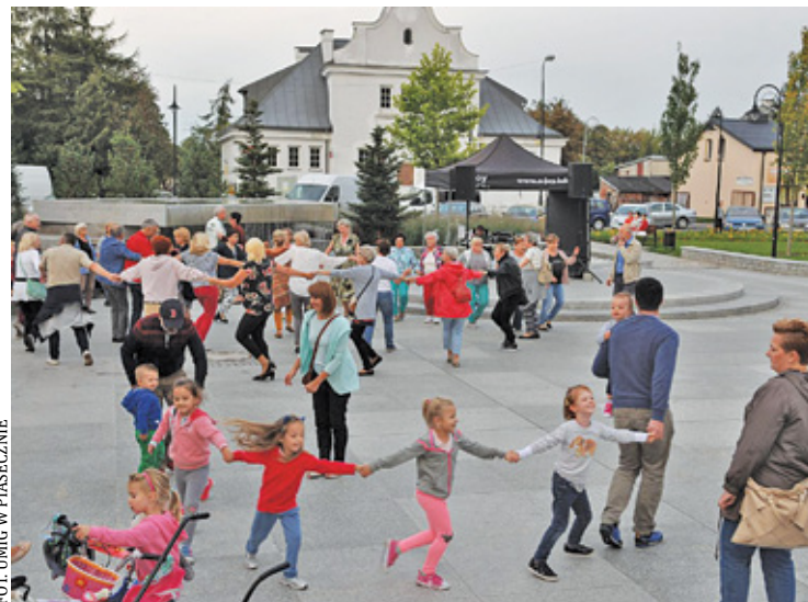
Tego lata potańcówek ma być więcej niż podczas poprzednich edycji

Pierwsza tegoroczna potańcówka odbędzie się w sobotę, 2 lipca. Będzie to wieczór kowbojski. W programie są pokazy tańca kowbojskiego prezento-