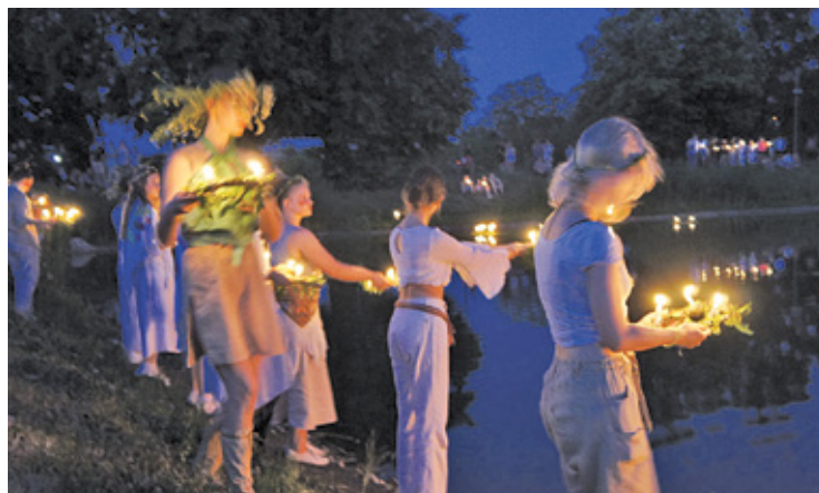
Jednym z odtwarzanych zwyczajów było puszczanie wianków na wodę w piaseczyńskim stawie

Impreza była także okazją do zapoznania się z działaniami Fundacji Nasz Wybór, która prowadzi w Warszawie Dom Ukraiński i pracuje na rzecz ukraińskich migrantów w Polsce.