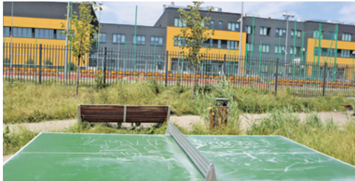
Na drugim stole pojawiły się malowidła

D o dewastacji stołów doszło prawdopodobnie w niedzielę rano (26 czerwca). Wprawdzie ulokowane są one poza ogrodzeniem Centrum Edukacyjno-Multimedialnego, na działce zarządzanej przez gminę, ale obejmuje je zasięgiem monitoring biblioteki. Sprawcę bądź sprawców najpewniej uchwyciły kamery.