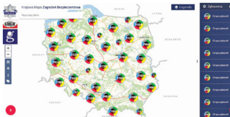
Zaobserwowane zagrożenia można dodawać do Krajowej Mapy Zagrożeń Bezpieczeństwa

Komenda Powiatowa Policji w Piasecznie do komunikacji z mieszkańcami wykorzystuje jeden z popularnych serwisów społecznościowych. – Dzięki obecności na Facebooku staliśmy się