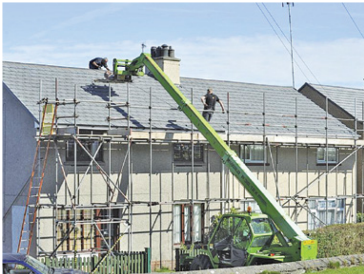
Rząd proponuje zniesienie pozwolenia na budowę domu jednorodzinne bez ograniczeń jego powierzchni

Rząd chce od 2023 roku zrezygnować z konieczności uzyskania pozwolenia na budowę domu jednorodzinne na własne cele mieszkaniowe, bez ograniczeń powierzchni, do dwóch kondygnacji – zapowiedział w trakcie czwartkowej konferencji prasowej minister rozwoju i technologii Waldemar Buda. – Przy budownictwie jednorodzinne dla domów, bez względu na powierzchnię, nie będzie-