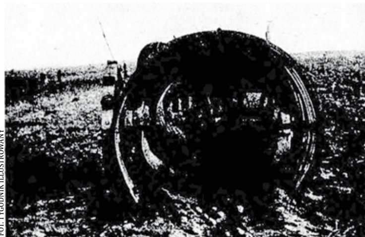
Kartoflarka systemu Bauerfeinda na polu w Gołkowie 1907 r.

„W historycznym Gołkowie pod Piasecznem, niegdyś własności Tep-