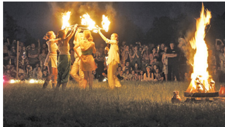
Niewiasty kusyły mężczyzn w szalonym tańcu wokół ognia