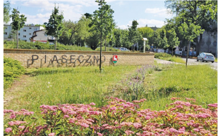
Włodarze gminy obawiają się, że zmiany podatkowe zaburzają jej dalszy rozwój