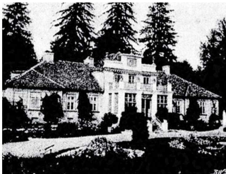
Pałac Teppera, tu już własność Bauerfeindów w 1907 r.

mody i pyszną wystawnością. Na strople wymalowany przez Byczkowskiego Kupido z kołczanem, strzelający do kryjących się w krzakach róż pasterek, od pępka filuternie zwiesza mu się kosztowny kryształowy pająk. Drzwi w prawo, w lewo z korynckimi kolumnami. W głębi wielkie dwa okna, w środku nich drzwi szklane o małych kwadratowych tafelkach zwierciadlanych. Za tą prawie całą szklaną ścianą terasa, otoczona kamienną balustradą z żółtymi wazonami. Z tarasu widok na francuskie kwatery i szpalery a w oddalonych Jazgarzewski las.”