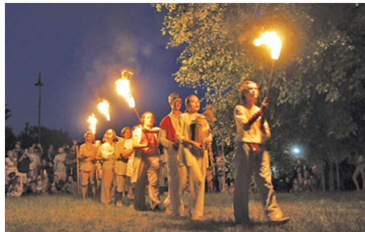
Rytuał kreślenia ogniem kręgu wokół wszystkich uczestników, którzy zgromadzili się w parku miejskim w Piasecznie

Pełne szalonej zabawy, ognia i zwyczajów widowisko zwieńczyło wydarzenie, które miało charakter dwujęzyczny. Zrealizowano je w ramach